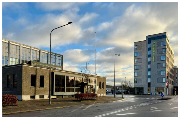
Bethaniakirken og B&B Hotels, Aalborg

Arrangementet finder sted i Bethaniakirken i Aalborg mens overnatning anbefales på et nyt hotel, der er kirkens nabo. Se praktiske informationer om pris og tilmelding på hjemmesiden for Evangelisk Frikirke Danmark. DIREKTE TIL TILMEDLING HER