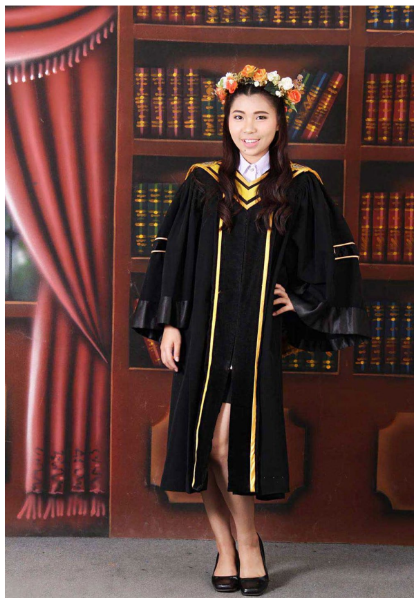
En skolegang der endte med en bachelor